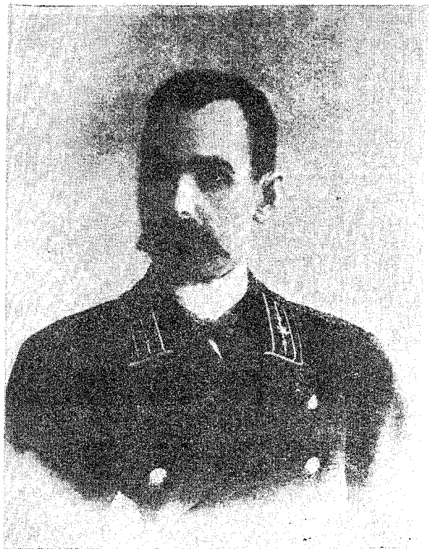
А. К. Сержпутовский (конец XIX в.)